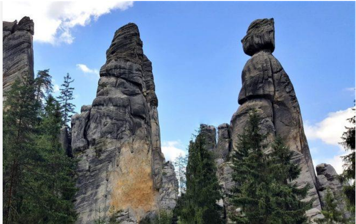
Adršpašské skály, "Rock Town"

Een goede plek om te beginnen is het stadje Broumov, de naamgever van het gebied. Geniet van het prachtige centrumplein, gedomineerd door een Mariakolom uit 1706 en een pestzuil. Of trek tijd uit voor een bezoek aan het Benedictijnerklooster met haar oogverblindende bibliotheek die beschikt over veel zeldzaam drukwerk.