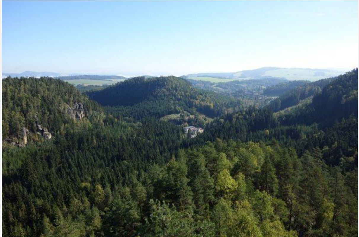
Uitzicht vanaf Adršpašské skály, "Rock Town"