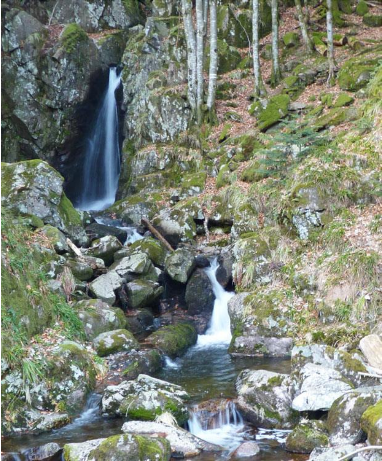
Cascades du Rummel