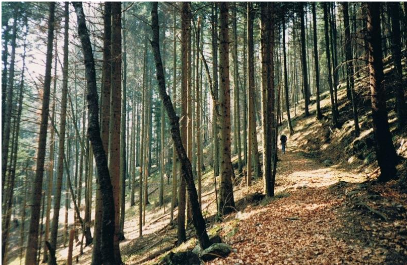
Tussen Moosch en Sewen