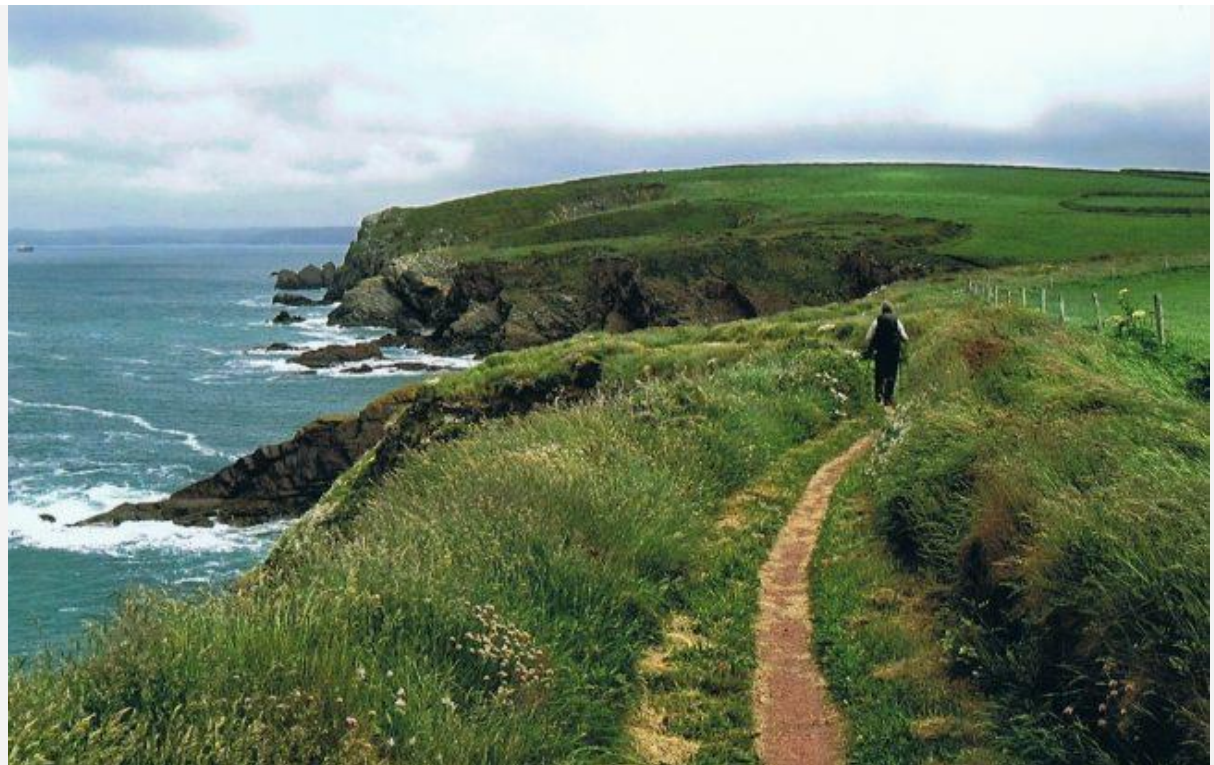
Het 'Pembrokeshire Coast Path'

De route ligt aan de zuidwest kust van Wales, onderdeel van het Verenigd Koninkrijk en ten westen van Groot-Brittannië. Het wandelpad volgt grotendeels de spectaculaire kliffen, op hoogte, met voortdurend fraaie uitzichten op de beukende zee, de enorme en grillige rotspartijen, de stranden. Ook voert het pad langs enkele fraaie Welshe dorpjes en stadjes. Klimmen en dalen, naar strandniveau en weer naar boven: het hoort erbij. In het voorjaar staat de kuststrook in volle bloei, met alle groene, bruine, gele en witte varianten die je maar bedenken kunt.