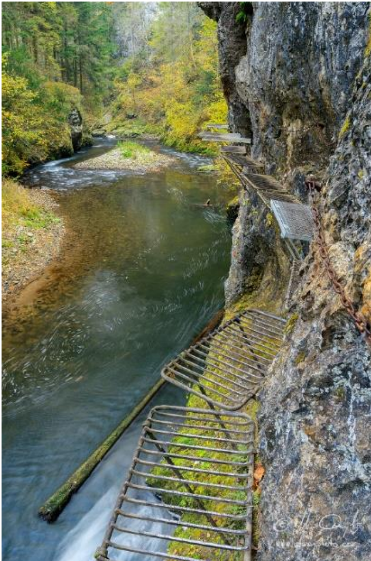
Langs en boven de Hornad