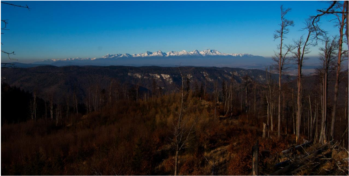
Uitzicht op de Tatras