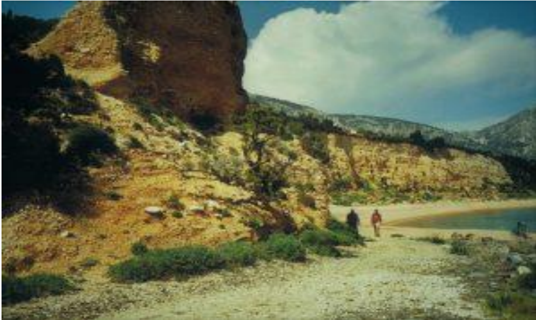
Strand bij Cala Gonone.