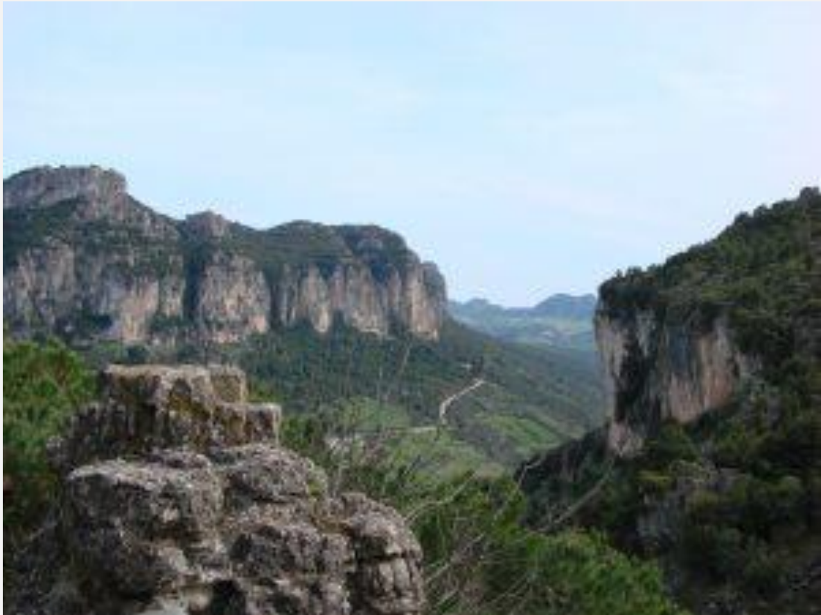
Omgeving Scala di Giorgo in de Gennargentu.

Als je het Italiaanse eiland Sardinië via het internet onderzoekt, krijg je een idyllisch beeld voorgeschoteld. Je ziet een schitterend eiland met fraaie natuur, mooie stranden, uitgestrekte wijngaarden, en avontuurlijke, onbewandelde paden. Als je ooit op Sardinië bent geweest, zal je dit beeld volledig kunnen bevestigen. Zelfs na vijf dagen wandelen, blijf je je verbazen over al het moois dat de Sardijnse natuur te bieden heeft. Er zitten echter wel een paar addertjes onder het gras.