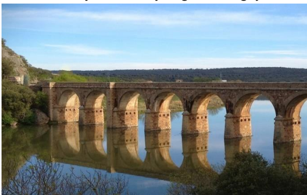
Zamora brug over de Douro

Om vervolgens, de volgende dag, de Meseta weer in te duiken. Je gaat ervan houden, zo wordt het gevoel. Hoewel totaal niet te vergelijken had ik dat ook bij het Noaberpad. De eerst etappe vanuit Nieuweschans. Door de kleiakkers en bietenvelden. Na verloop van tijd ga je houden van de uitgestrektheid, van de "leegte", van de imponerende oneindige landschappen en dringt er iets van een besef tot je door dat je eigen belangrijkheid best wat minder kan. Of zoiets.