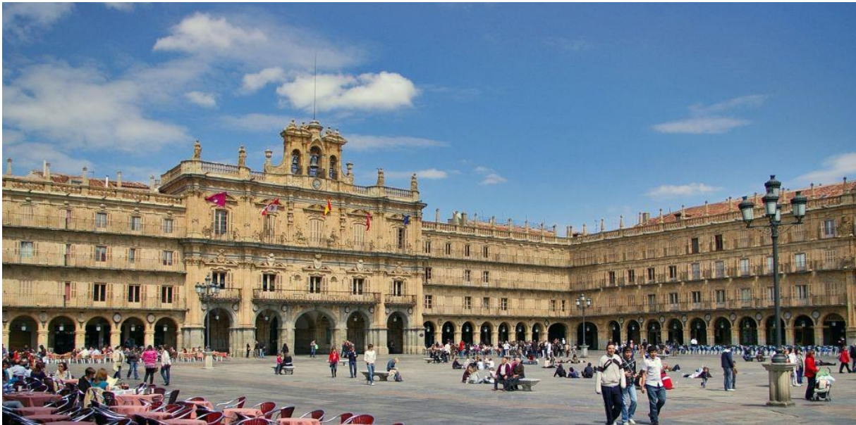
Plaza mayor Salamanca