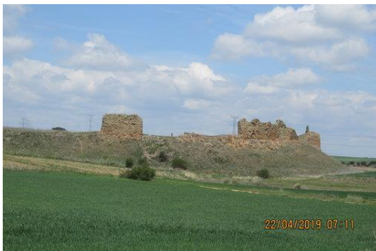
Burcht ridders van Santiago